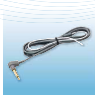
サーミスタ温度プローブ(体表面) S-DV用