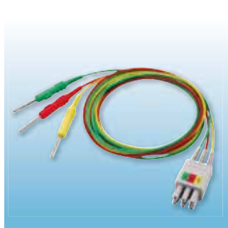
3極ECGリード線Sピン S-DV用