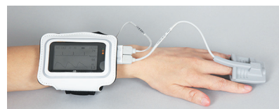
アームバンド使用例