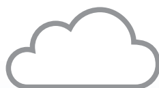
チェックミー対応クラウドシステム Checkme cloud チェックミークラウド

医療現場でも好評の医療機器認証取得のチェックミーは、心電図・SpO2など各種機能を搭載したマルチヘルスマニタです。