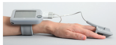
シリコンケースとスラップバンド使用例