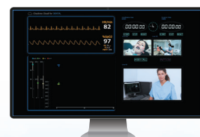
歯科麻酔遠隔監視システム Harmony ハーモニー

チェックミーの活用の幅を広げるためのサービスとして、専用のクラウドを構築しオンラインに対応します。