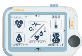
携帯型マルチヘルスマニタ Checkme チェックミー

歯科麻酔遠隔監視システム"ハーモニー"は 遠隔地の麻酔科医へチェックミー対応クラウドシステムを利用して 患者様のバイタルデータをリアルタイムで送信し 状況の変化に指示対応できるオンラインプログラムです。